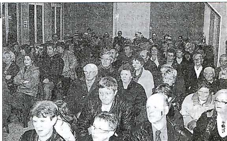
Même dans les petites communes, les vœux restent un grand moment, auquel la population assiste en nombre.